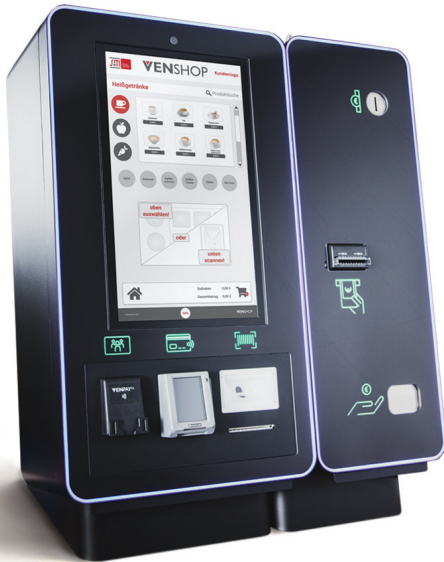
Cashless-Modul + Zusatzmodul (cash)

Dieser ermöglicht als zentrales Zahlungssystem für den gesamten Shop, inklusive aller Automaten, sowohl bargeldlose Zahlungen aller Art als auch auf Wunsch Zahlungen mit Bargeld.